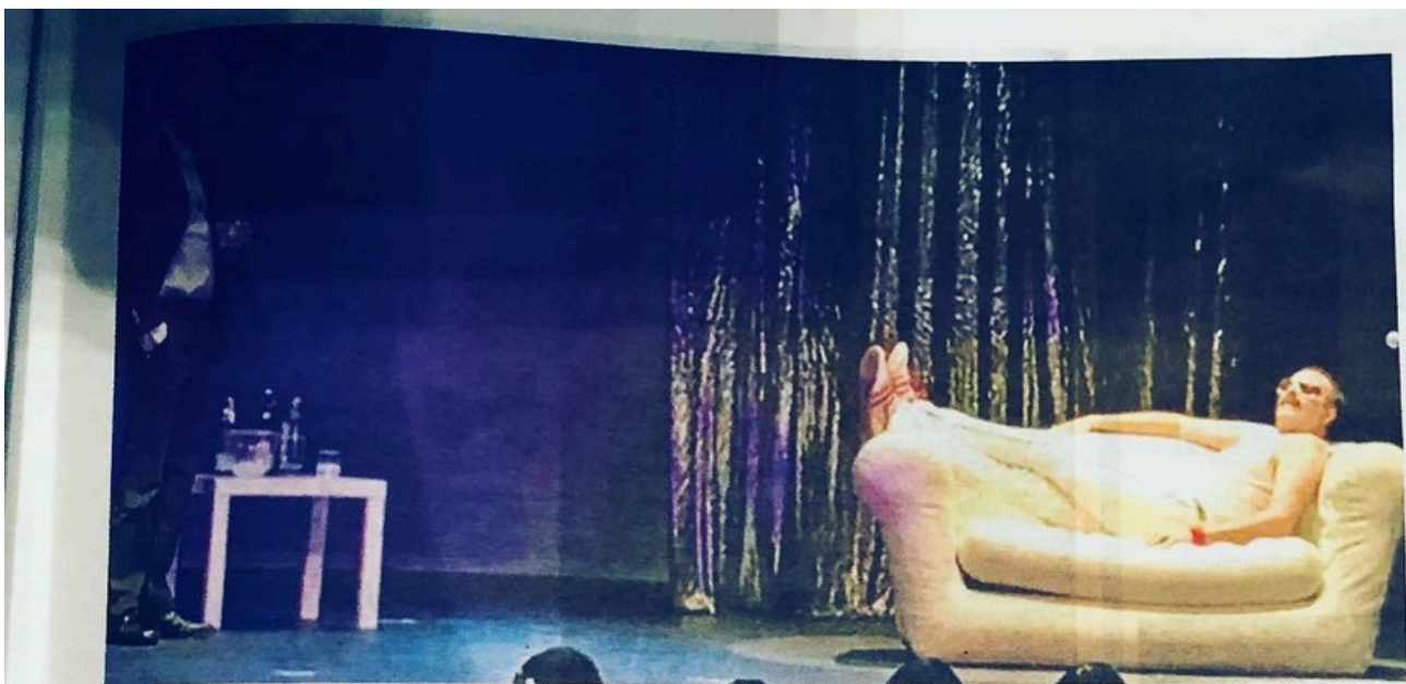
Una escena de la obra 'Desnudando a Freddie'.

Actualmente contamos con ellos en la cartelera madrileña con Desnudando a Freddie , segunda temporada de este espectáculo en el Teatro de las Aguas, en el que el líder de Queen nos habla, desde el más allá, sobre todos esos aspectos que conformaron su leyenda.